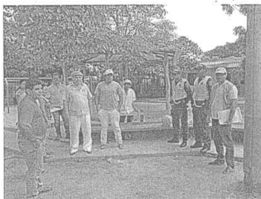
Foto N° 3 Fecha: 07 de Junio de 2017. Ubicación: Plaza del Corregimiento de Cuatro Bocas jurisdicción del municipio Tubará / Atlántico. Observaciones: Comunidad del corregimiento de Cuatro Bocas.