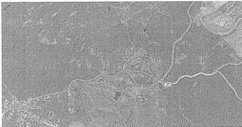
Figura N° 1. Fecha: 09 de Junio del 2017. Ubicación: Finca "El Cacique" – Km 14 Corregimiento de Cuatro Bocas jurisdicción del municipio Tubará / Atlántico. Observaciones: Vista satelital – Finca el Cacique aproximada (círculo rojo), Tomada de Google Earth / Enero 10 de 2017.