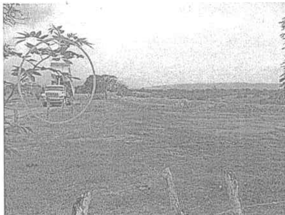
Foto N° 2 Fecha: 07 de Junio de 2017. Ubicación: Finca "El Cacique" – Km 14 Corregimiento de Cuatro Bocas jurisdicción del municipio Tubará / Atlántico. Observaciones: Actividades de descargue.