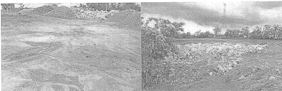
Foto N° 6 - N°7. Fecha: 09 de Junio de 2017. Ubicación: Finca "El Cacique" – Km 14 Corregimiento de Cuatro Bocas jurisdicción del municipio Tubará / Atlántico. Observaciones: Porción de terreno en proceso de nivelación