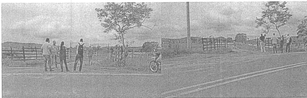
Foto N° 5 - N°4. Fecha: 09 de Junio de 2017. Ubicación: Finca "El Cacique" – Km 14 Corregimiento de Cuatro Bocas jurisdicción del municipio Tubará / Atlántico. Observaciones: Entrad principal Finca El cacique.